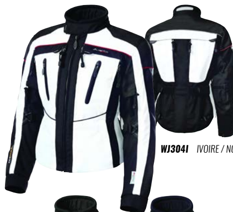
WJ304I IVOIRE / NOIR