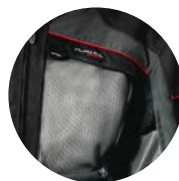
PANNEAUX AVANT VERS LE BAS