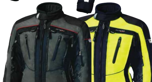
WJ304G GRIS / NOIR